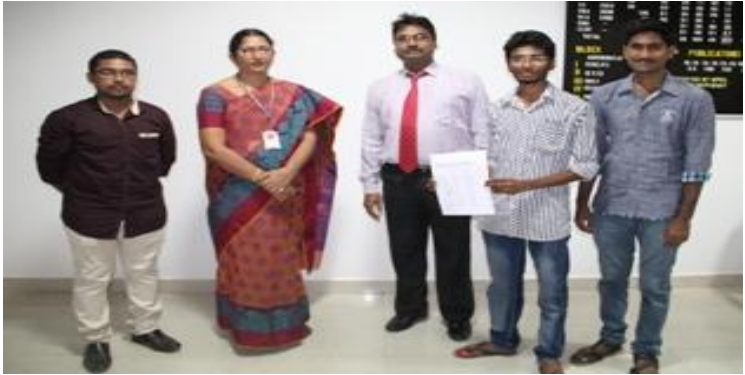
Selected students with the Principal & HoD

Some students of B.Tech final year got selected to participate in the "National Level Innovation Challenge Competition" at IIT, Delhi, Massachusetts Institute of Technology (MIT),U.S.