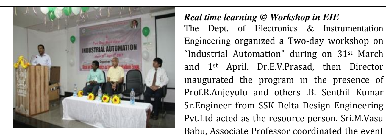
A view of the inagural function