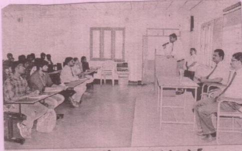
శిక్షణ తరగతుల్లో మాట్లాడుతున్న ప్రెస్బిటేరియన్