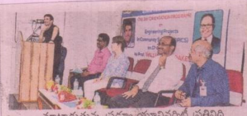
మాట్లాడుతున్న ప్రద్యూ యూనివర్సిటీ ప్రతినిధి